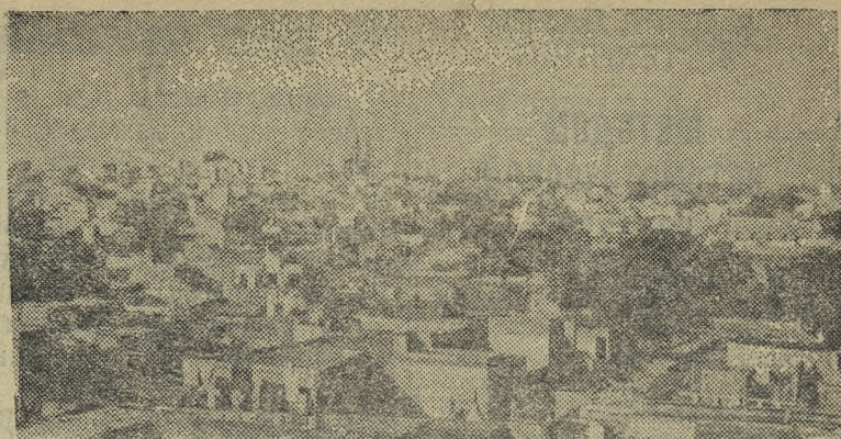
Индия. Вид старого района столицы Индии города Дели.