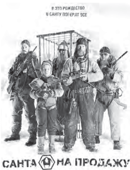
САНТА НА ПРОДАЖУ

Порою кажется, что новогодним праздникам уделяют слишком внимания и от этого теряется ощущение чуда. Однако от этого фильма вы уйдете (если рискне-