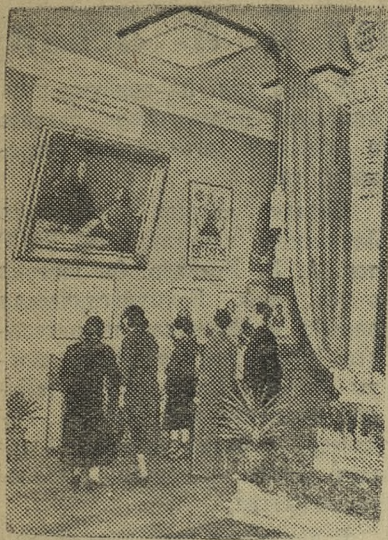
Москва. Выставка «Пятьдесят лет первой русской революции» в Государственном Музее Революции СССР.

На снимке: в одном из залов.