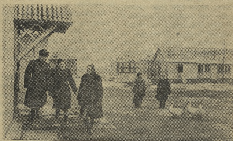
Саратовская область. В новом совхозе «Дергачевский», основанном на целинных землях, сооружено около тридцати жилых домов, столовая, баня и другие помещения. В ближайшее время здесь начнется строительство больницы и школы. На территории центральной усадьбы совхоза заложен сад площадью в семь гектаров.

Большой интерес и живое обсуждение вызвал второй вопрос повестки заседания: «Разбор и реагирование на жалобы трудящихся». С обобщением на бюро выступил зам. председателя завкома профсоюза тов. Осицов.