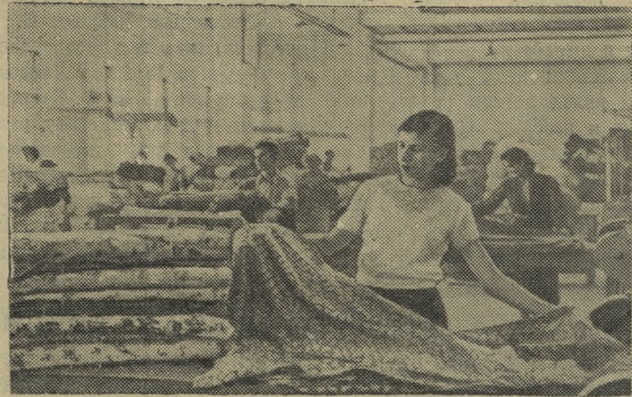
Народная Республика Албания. Тирана. Коллектив крупнейшего предприятия текстильной промышленности страны — комбината имени Сталина борется за дальнейшее повышение качества продукции. Все изделия, выпускаемые комбинатом, подвергаются строгой проверке.

БУХАРЕСТ. До освобождения страны от антинародного режима румынская кинематография имела очень отсталую техническую базу. За годы же народной власти только в румынской киностудии «Букурешть» построены 3 больших съемочных павильона. В 1956 году близ Бухареста будет закончено строительство крупного киноцентра. 5 января. (ТАСС).