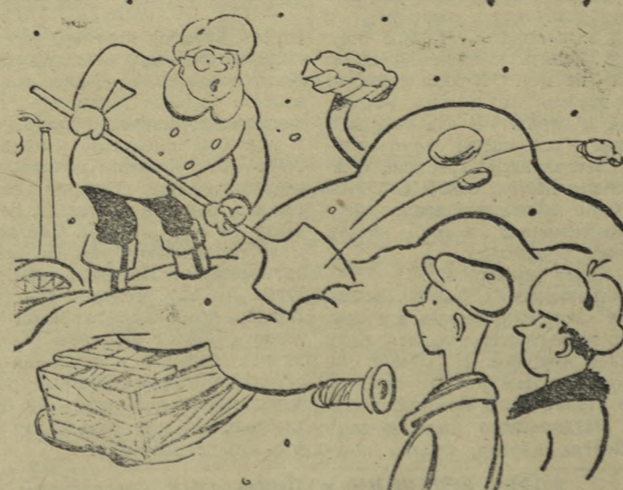
— Сейчас, товарищи, я постараюсь показать вам новые станки.