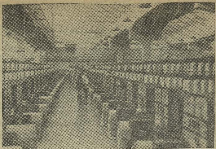
КИТАЙСКАЯ НАРОДНАЯ РЕСПУБЛИКА. К концу первой пятилетки выпуск хлопчатобумажных тканей в Китае увеличился по сравнению с 1952 годом на 48,6 процента. Новые текстильные предприятия по первому пятилетнему плану строятся во многих районах страны.

На снимке: в одном из цехов нового текстильного комбината в Пекине.