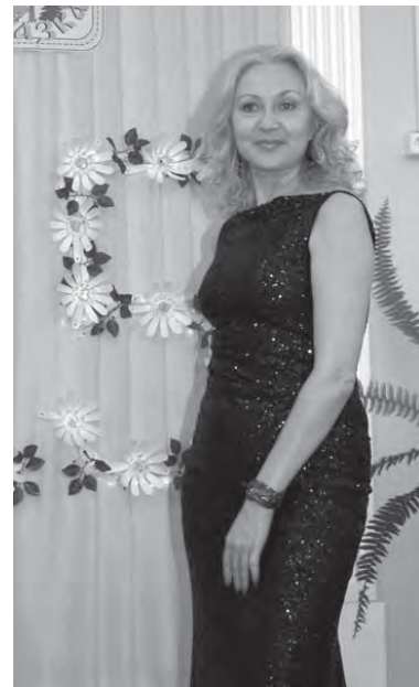
тема отдельного разговора.