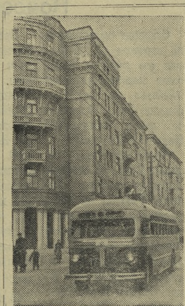
В Саратове недавно пущена новая, третья троллейбусная линия, связывающая центр города с Октябрьским районом.

В области расширяется культурное строительство. В канун праздника 38-й годовщины Великого Октября трудящиеся гор. Саратова и окружающих рай-