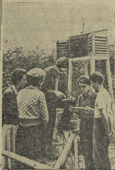
Германская Демократическая Республика. В Гренингене (округ Магдебурга) на базе сельскохозяйственного производственного кооператива «Социализм» работает учебный комбинат «Молодая гвардия». Здесь приобретают необходимые знания и повышают квалификацию члены сельскохозяйственных производственных кооперативов.