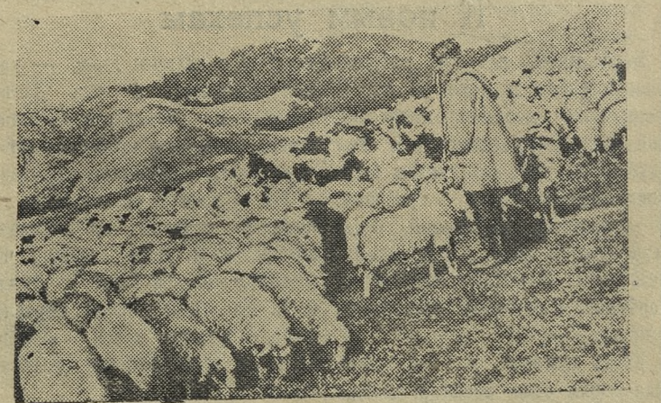
Народная Республика Албания. На горных пастбищах.