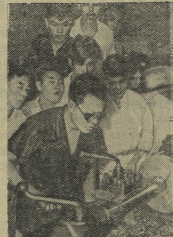
На предприятиях Китайской Народной Республики ведется обмен опытом работы, организовано распространение передовых приемов труда. Недавно на Инструментальном заводе в Шанхае состоялся показ методов скоростной обработки металла, принятых на советских предприятиях, в котором приняло участие 39 передовых рабочих.