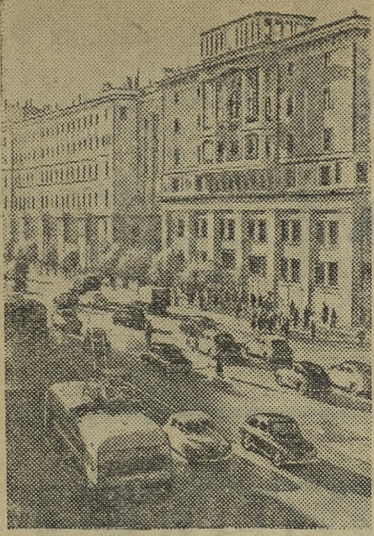
Москва сегодня. Улица Горького.

Открытое письмо к комсомольцам и всей молодежи города