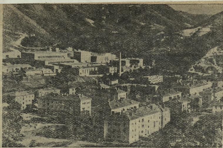
Народная Республика Болгария. Общий вид промышленного города Рудозема в Родопском горнорудном бассейне.

ЗАЯВЛЕНИЕ КАПИТАНА АНГЛИЙСКОГО СУДНА НЬЮ-ЙОРК, 3 октября. (ТАСС). Как сообщает корреспондент агентства Юнайтед Пресс из Гон- конга, капитан английского судна «Тэфрос», которое было на днях обстреляно чанкайшестскими самолетами, Алан Рассел Мэр- чент заявил, что нападение чан- кайшестских самолетов на его судно носило «преднамеренный характер». Они, — заявил Мэр- чент, — сбрасывали бомбы, что- бы потопить судно, и обстрелива- ли его из пулеметов, чтобы убить людей. Мэрчент подчеркнул, что нападение было совершено само- летами американского производ- ства, которые стреляли американ- скими пулями.