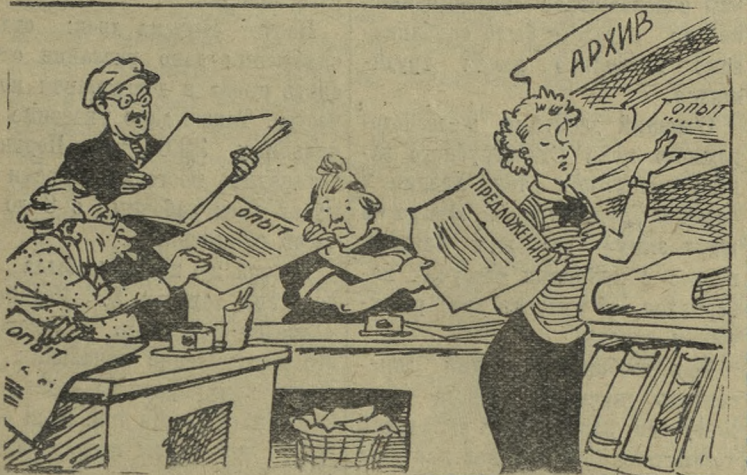
Как некоторые понимают передачу опыта передовиков.

В ряде цехов завода сантехизделий, Старотрубного и некоторых других предприятий слабо изучается и распространяется передовой опыт новаторов производства.