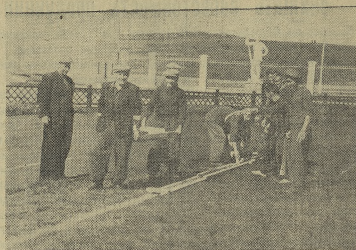
Перед открытием нового стадиона. Футболисты производят разметку поля.

«Национальная ассоциация работников сельского хозяйства» обратилась к президенту Чили со специальным посланием, в котором сообщает о трагических последствиях засухи, охватившей в этом году 13 центральных и северных провинций страны и просит срочного вмешательства для предотвращения массового голода. В сообщении говорится, что от засухи в этих районах уже погибло 75 процентов урожая. Из-за отсутствия кормов и воды гибнет скот. Возросла до огромных размеров спекуляция, еще больше усугубляет положение владельцев и арендаторов мелких земельных участков. (ТАСС).