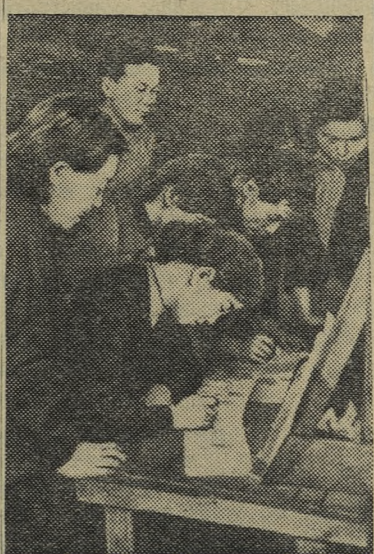
ЯПОНИЯ. Сбор подписей под Венским Обращением Всемирного Совета Мира против подготовки атомной войны. НА СНИМКЕ: японские рабочие типографии ставят свои подписи под Обращением.

сматривает результаты работ ученых-атомников многих стран. Такой обмен опытом облегчит и ускорит работы по использованию атомной энергии в мирных целях, поможет найти правильные пути к тому, чтобы атом был поставлен на службу делу мира.