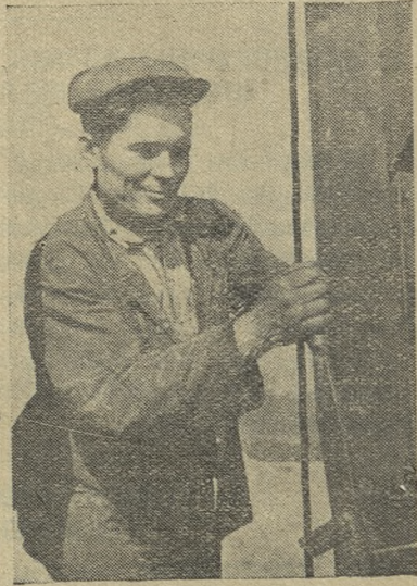
Г. А. ЖУКОВ.

Организовать регулярное снабжение населения овощами и картофелем — обязаны руководители ОРСов и подсобных хозяйств.