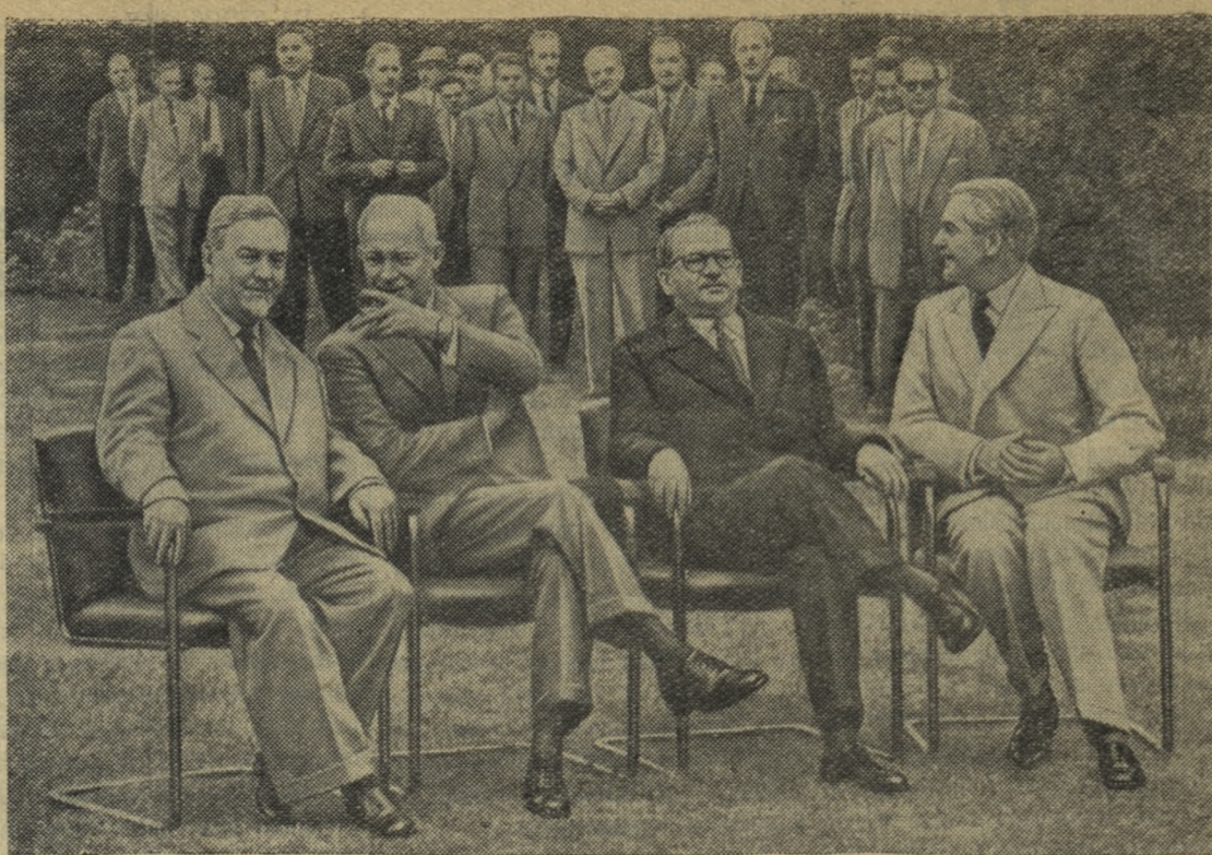
Перед заседанием Совещания Глав правительств четырех держав в Женеве. Слева направо — Председатель Совета Министров СССР Н. А. Булганин, Президент США Д. Эйзенхауэр, Премьер-Министр Франции Э. Фор и Премьер-Министр Англии А. Иден за беседой у Дворца Наций.