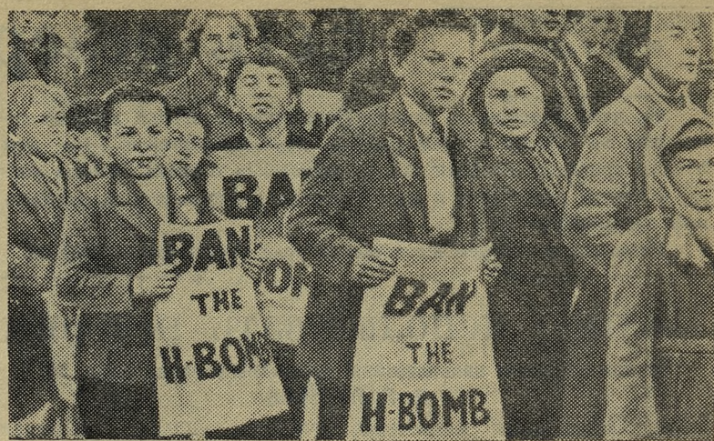
Недавно в Лондоне состоялась демонстрация против подготовки атомной войны, в которой участвовало около пяти тысяч человек, в том числе много детей.

Ожидается приезд на слет гостей — юных туристов Ленинграда, Ашхабада, Свердловска.