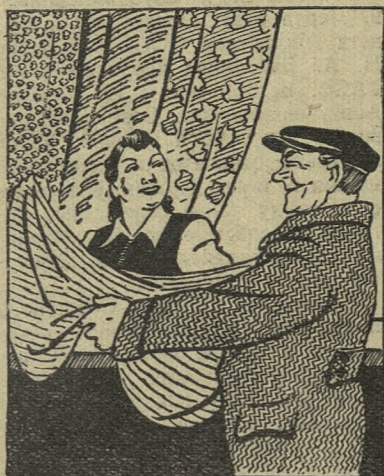
Материал купил чудный...

В некоторых пошивочных мастерских нашего города недобросовестно относятся к заказам граждан и из хорошей материи шьют плохую одежду.