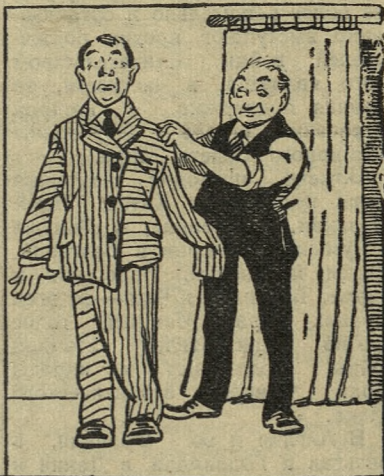
...а костюм сшили чудной.