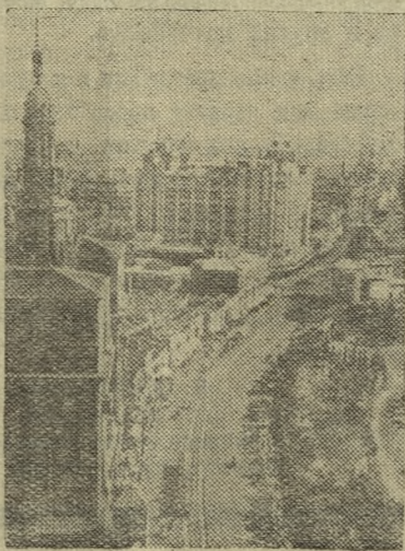
КИТАЙСКАЯ НАРОДНАЯ РЕСПУБЛИКА

В различных районах Кореи Народной Демократической Республики ведется подготовка к разработке богатых каменноугольных месторождений. Готовится закладка шести новых шахт в угольных районах Синчхан, Коре-ван и других. С вводом их в строй намного возрастет добыча угля. Так, например, угольные копи Синчхан увеличат добычу на 600—700 тысяч тонн в год. (ТАСС).