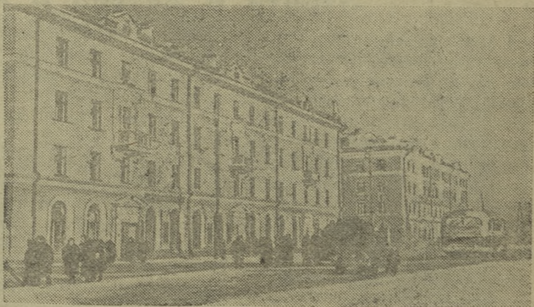
ОМСК — большой промышленный и культурный центр Сибири. В городе 8 вузов, несколько десятков техникумов, построено много первоклассных заводов и фабрик. Недавно пущена первая очередь городского телевизионного центра. У горожан на квартирах появились первые сотни телевизоров. За последние два года в городе построено и введено в эксплуатацию 248 жилых домов, 5 новых школ, два клуба, много детских и лечебно-профилактических учреждений.

На снимке: новые 45-квартирные дома по улице X-летия Октября.