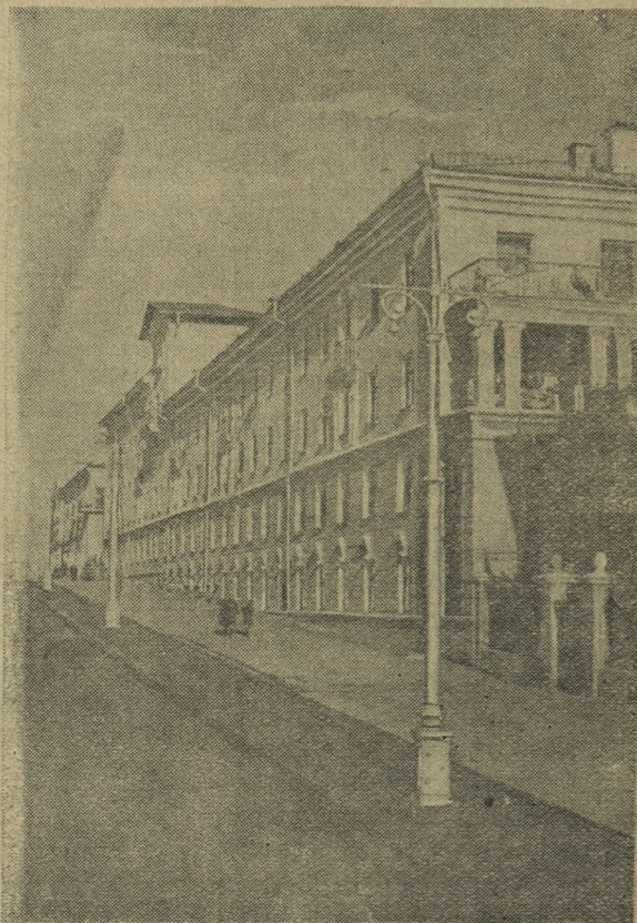
НА СНИМКЕ: новый жилой дом на 64 квартиры по улице имени Ватутина.