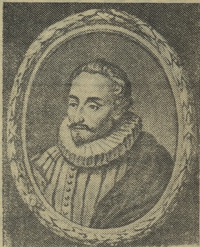
На снимке: портрет Мигеля Сервантеса.

В своей гениальной книге Сервантес показывает обедневшего рыцаря, который, несмотря на свою человечность, на симпатии к простым людям, далек от жизни, от действительности. Имя Дон-Кихота стало нарицательным. Так называют теперь идеалистов, оторванных в своих мечтаниях от жизни, ведущих бесплодную борьбу и не учитывающих при этом реальные исторические условия.