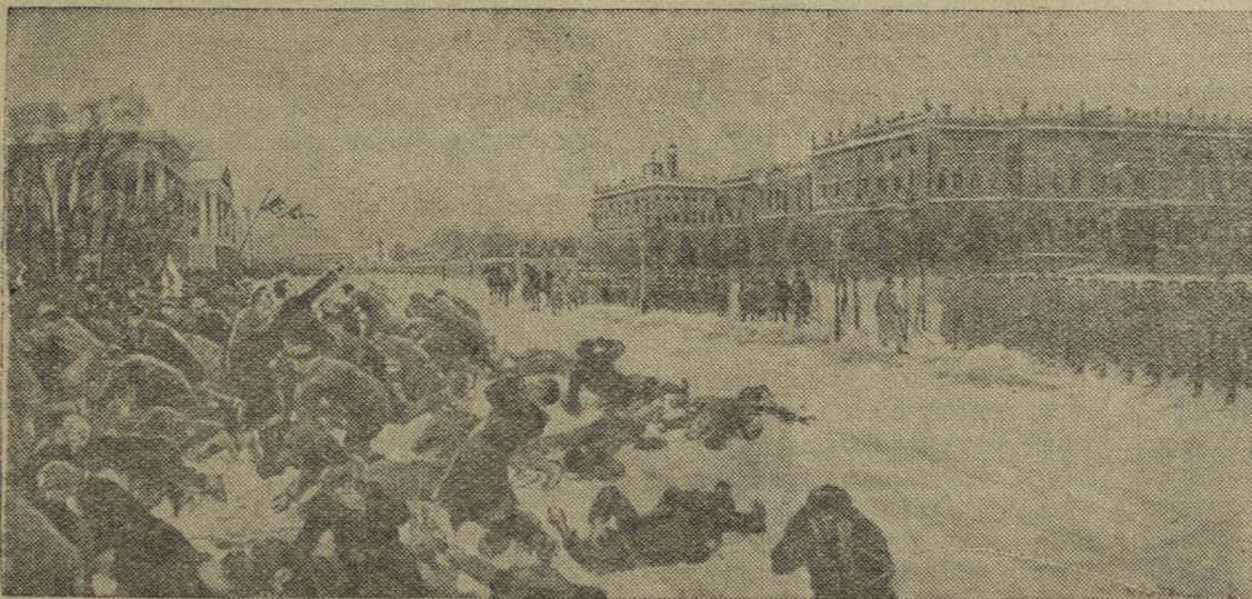
«Расстрел рабочих у Зимнего дворца 9 января 1905 г.». Репродукция с картины художника И. Владимирова.