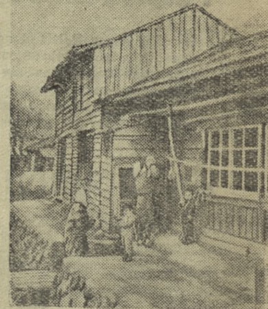
СЕВЕРНАЯ ЯПОНИЯ. Хижины, в которых ютятся трудящиеся.

По Государственному 3-проц. внутреннему выигрышному займу тиражи выигрышей состоятся в обычные сроки.