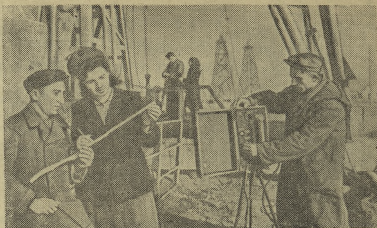
БАКУ. Промысел № 1 управления «Азизбековнефть» досрочно выполнил план 1954 года. Благодаря хорошей организации исследовательской работы нефтяники добились отличного технологического режима эксплуатации скважин.