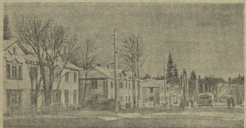
БАШКИРСКАЯ АССР. В поселке строителей Уфимской ГЭС построены дома площадью в 35 тысяч квадратных метров. Возведены школы, клуб, больница, детские сады и ясли, пенарни, столовые, магазины, проложен водопровод.

Текстильщики суконного комбината «Нарие-коммуна» приступили к выпуску новой шерстяной ткани «волна» для женских пальто. На комбинате «Большевик» начато производство льняного полотна (плотных костюмов. (ТАСС).