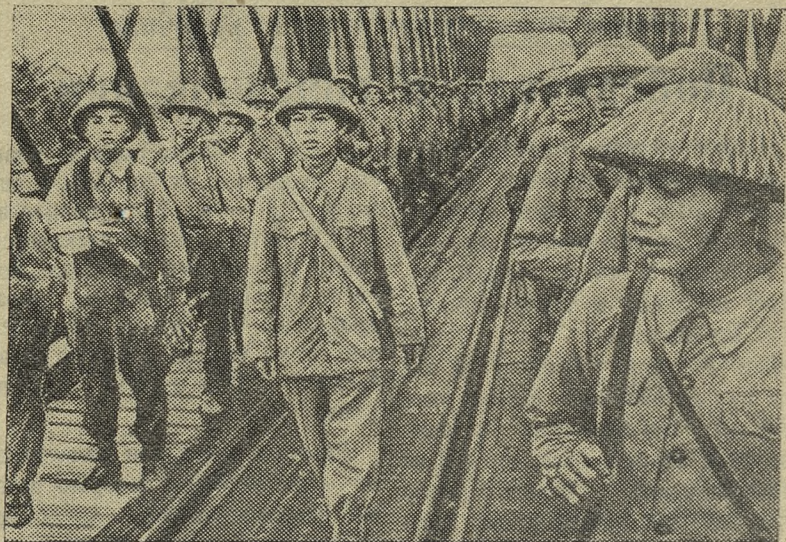
ДЕМОКРАТИЧЕСКАЯ РЕСПУБЛИКА ВЬЕТНАМ. Недавно состоялась передача города Ханоя Демократической Республике Вьетнам.

На снимке: отряды Народной армии вступают в Ханой.