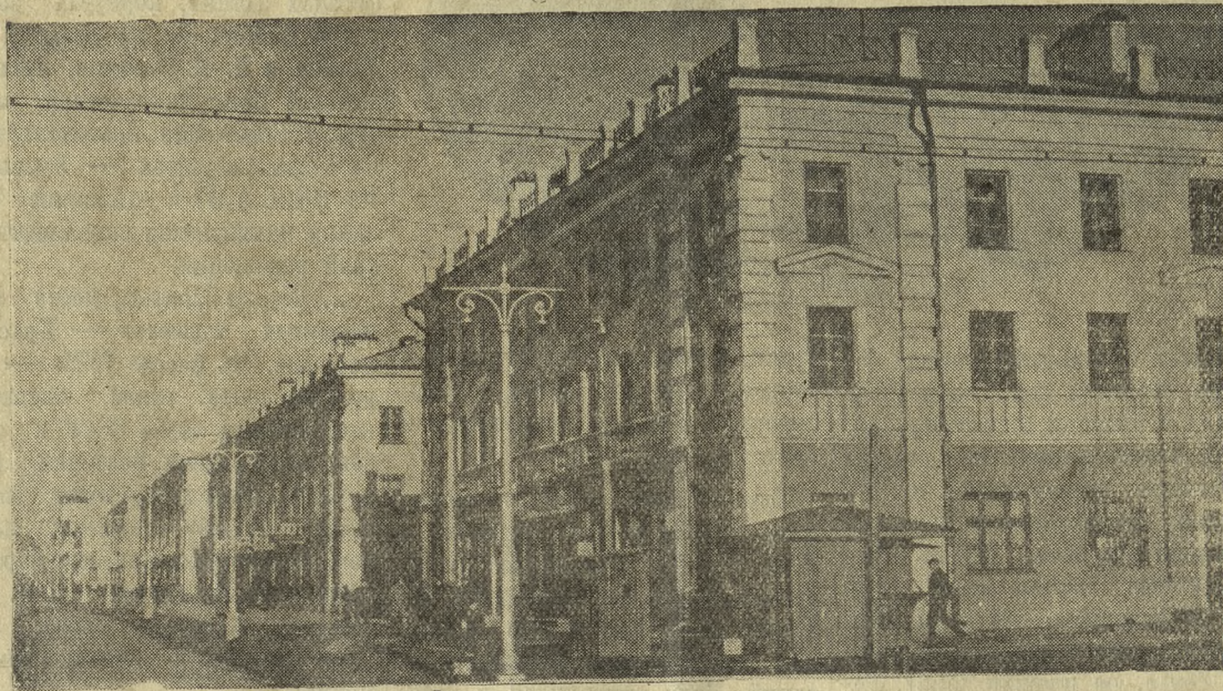
На снимке: общий вид улицы имени Ватутина в Соцгороде.

После Великой Отечественной войны трудящиеся города с новой силой развернули социалистическое соревнование за досрочное выполнение пятого пятилетнего плана и задач, поставленных перед народом в исторических решениях XIX съезда КПСС и последующих постановлениях партии и правительства. Как в предыдущие годы, так и в дни предок-