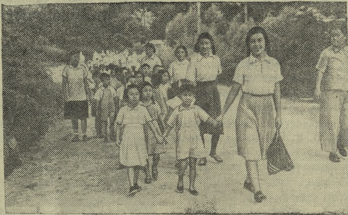
КИТАЙСКАЯ НАРОДНАЯ РЕСПУБЛИКА. На летнее время воспитанники многих городских детских садов выезжают на морское побережье.

НА СНИМКЕ: воспитанники тяньцзиньского детского сада на морском курорте Бэйдайхэ.