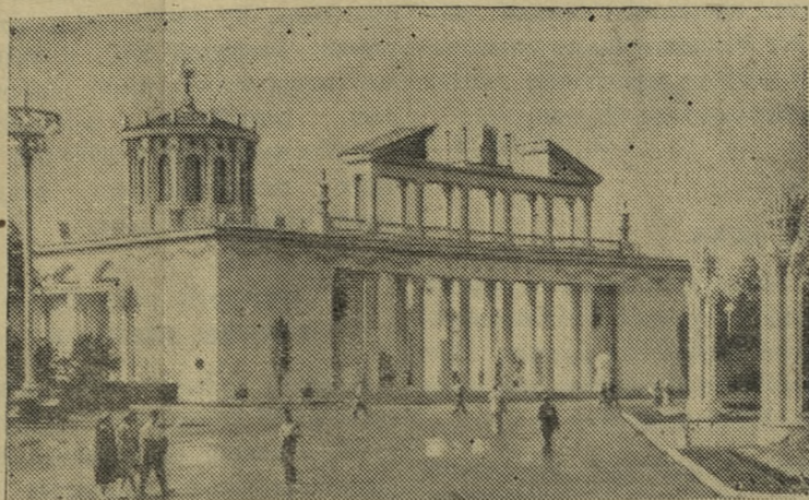
МОСКВА. Всесоюзная сельскохозяйственная выставка. Павильон «Совхозы».

Главный архитектор Всесоюзной сельскохозяйственной выставки.