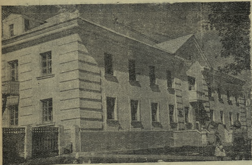
НА СНИМКЕ: новое здание общежития № 1 Динасового завода.