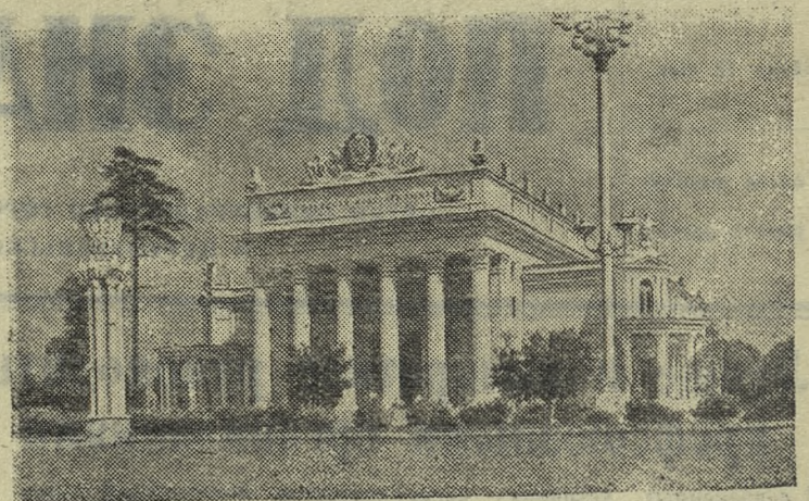
МОСКВА. Всесоюзная сельскохозяйственная выставка. Павильон «Российская Советская Федеративная Социалистическая Республика».