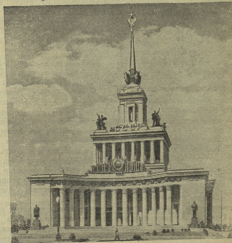
Москва. Всесоюзная сельскохозяйственная выставка. Главный павильон (вид со стороны главного входа).

Отмечая день железнодорожника, дирекция и завком завода премировали 17 передовиков транспорта и 5 человек отмечены приказом начальника цеха.