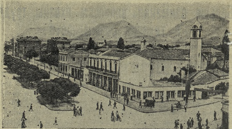
НАРОДНАЯ РЕСПУБЛИКА АЛБАНИЯ.

В эти дни внимание всех народов приковано к Женевскому совещанию, одной из задач которого является восстановление мира в Индокитае. Пути к мирному урегулированию войны в Индокитае ясно изложены в недавних заявлениях на Женевском совещании главы советской делегации В. М. Молотова, главы делегации Китайской Народной Республики Чжоу Энь-лая и главы делегации Демократической Республики Вьетнам Фам Ван Донга. Урегулирование путем переговоров вопроса о восстановлении мира в Индокитае, указывается в этих заявлениях, возможно лишь на основе признания национальных прав и демократических свобод народов Индокитая, на основе равенства и учета национальных интересов.