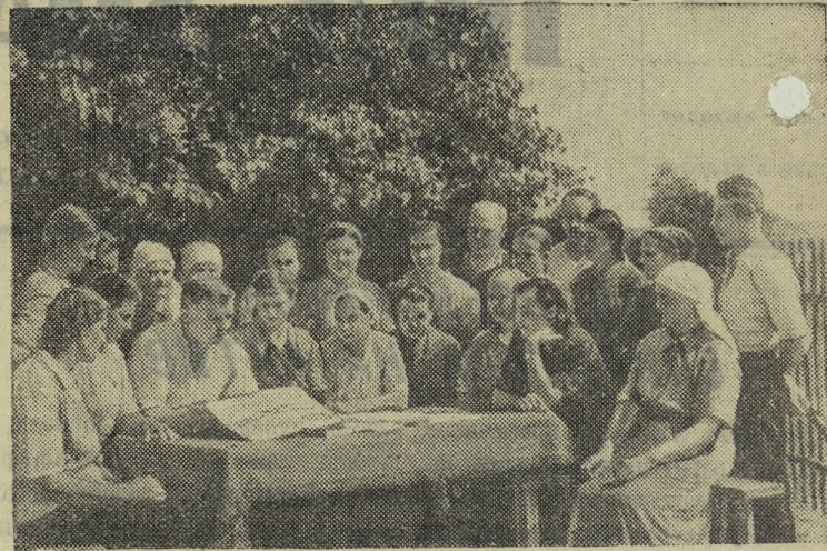
МОСКОВСКАЯ ОБЛАСТЬ. Во всех колхозах, совхозах и МТС проводятся читки постановления Пленума ЦК КПСС «Об итогах весеннего сева, уходе за посевами, о подготовке к уборке урожая и обеспечении выполнения плана заготовок сельскохозяйственных продуктов в 1954 году».

До конца пятилетки осталось полтора года. Коллектив трудящихся Новотрубного завода полон решимости и он, безусловно, выполнит задания по росту производства, производительности труда и снижению себестоимости, предусмотренные директивами XIX съезда Коммунистической партии Советского Союза.