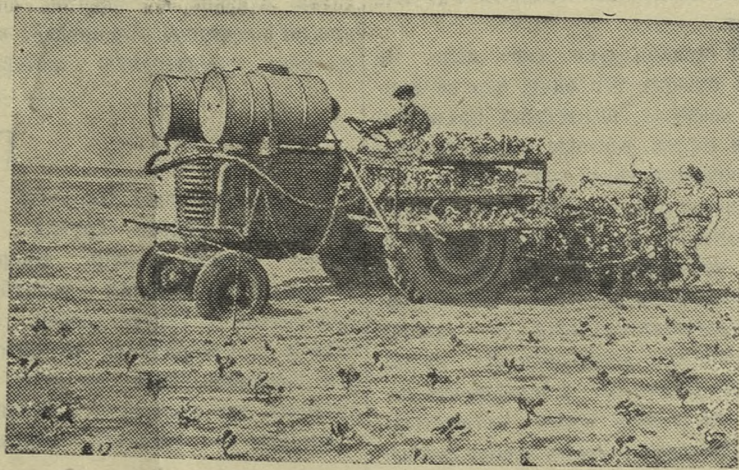
ПСКОВСКАЯ ОБЛАСТЬ. В совхозе «Диктатура» применяется новейшая агротехника.

Справочник для поступающих в высшие учебные заведения в 1954 г. Изд. «Советская наука», 1954 г., цена 5 руб.