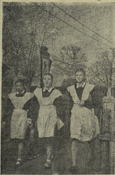
Учащиеся старших классов школ нашего города заканчивают сдачу экзаменов.