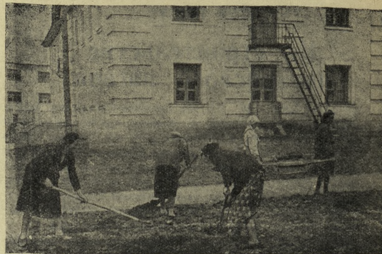
Большую помощь оказывают в благоустройстве своего поселка жители Соцгорода.

Любовное отношение к своему делу, наблюдательность и внимание во время работы, постоянное стремление не стоять на месте, а двигаться вперед — все это помогает мне совершенствовать свое мастерство, поднимать производительность. Совсем недавно мы бурили за смену по 2 погонных метра, а сейчас моя выработка, как правило, достигает 6 метров, а иногда и 8. Но я уверен, что это не предел, можно поднять производительность станков еще выше. Нужно только, чтобы за это постоянно боролись все — от машиниста до начальника рудника.