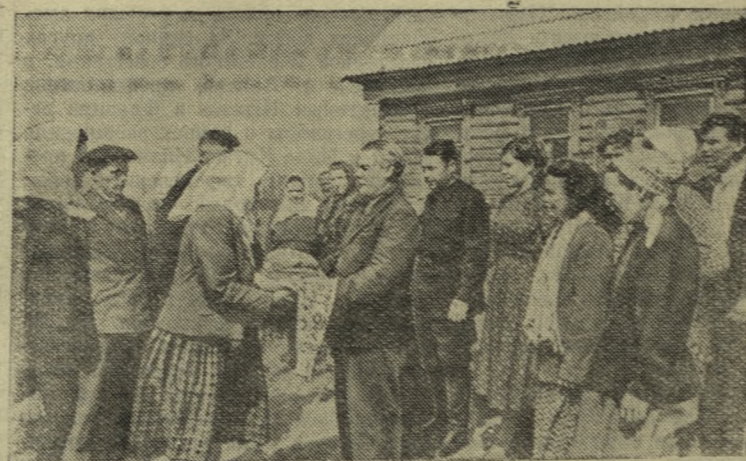
МОСКОВСКАЯ ОБЛАСТЬ. Ширится соревнование колхозов Украинской ССР с сельскохозяйственными артелями Подмоскovie. Недавно в Наро-Фоминском районе побывали представители сельхозартели имени Шевченко Золотоношского района Черкасской области. Они осмотрели ряд колхозов, ознакомились с опытом передовиков сельского хозяйства, рассказали о своих достижениях. Гости вызвали на социалистическое соревнование колхозников сельхозартели имени 8 марта.

НА СНИМКЕ: колхозники сельхозартели имени 8 марта встречают украинских колхозников.