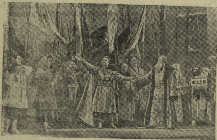
В Москве состоялся выступление Киевского театра оперы и балета имени Т. Г. Шевченко. Показ своего искусства театр начал оперой заслуженного деятеля искусств УССР композитора К. Давиденко «Богдан Хмельницкий» (либретто В. Василевской и А. Корнейчука).

Используя опыт Первоуральского завода, прокатчики завода имени К. Либкнехта разработали и внедрили почасовой график скоростной прокатки труб. В основу этого графика положены достижения лучших прокатчиков завода. Применение почасового графика повысило производи-