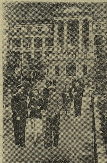
СОЧИ. На Черноморском побережье Кавказа начался весенне-летний сезон. Десятки тысяч трудящихся проводят здесь свои отпуска.

Потребителями энергии Дубоссарской ГЭС станут около 180 колхозов Молдавии.