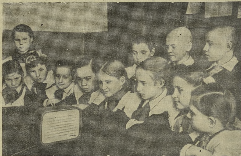
Учащиеся школы № 1 слушают свои выступления по местной радиопередаче, записанные на пленку.