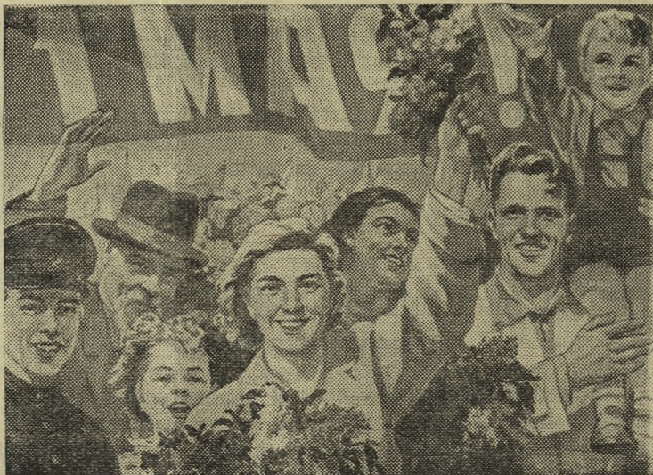
Плакат художника Н. Батолиной (Государственное издательство изобразительного искусства).

ственная сессия Первоуральского городского Совета депутатов трудящихся, посвященная 1 Мая. С докладом выступил т. Жирнов В. Н.