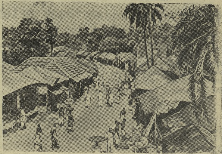
ИНДИЯ. Торговая улица большой деревни в Западной Бенгалии. Деревня расположена на шоссе, ведущем из Калькутты в штат Бихар.

На конфискацию полицией последнего воскресного номера коммунистической газеты «Юманите диманш» французские трудящиеся ответили усилением помощи демократической печати. Только за один день в фонд помощи органу французской коммунистической партии было пожертвовано более 1200 тысяч франков.