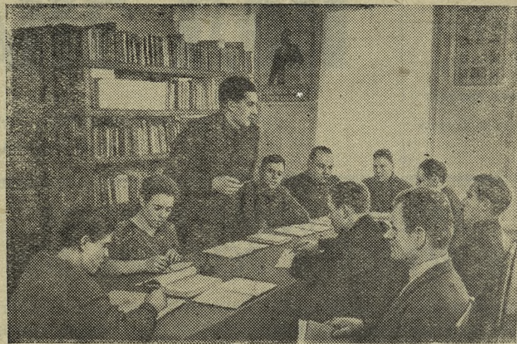
НОВОСИБИРСКАЯ ОБЛАСТЬ. В селе Каменка Новосибирского района в сети партийного и комсомольского просвещения работает пять кружков.