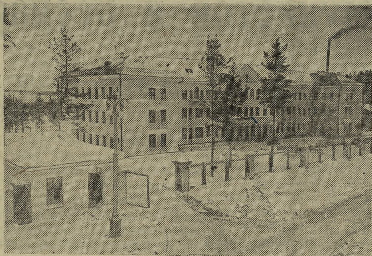
Растет и хорошеет сеть лечебных учреждений нашего города. Недавно в Соцгороде вступила в эксплуатацию новая больница.

Пожелаем же Вам, товарищи, счастливого пути и больших успехов на новом месте!