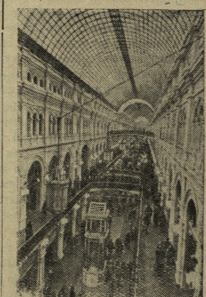
МОСКВА. Новый Государственный универсальный магазин (ГУМ) является образцовым предприятием советской торговли. В нем 143 секций, в которых обслуживают покупателей 1.250 продавцов. Общая длина прилавка ГУМа составляет два с половиной километра.

На снимке: в универсаме.