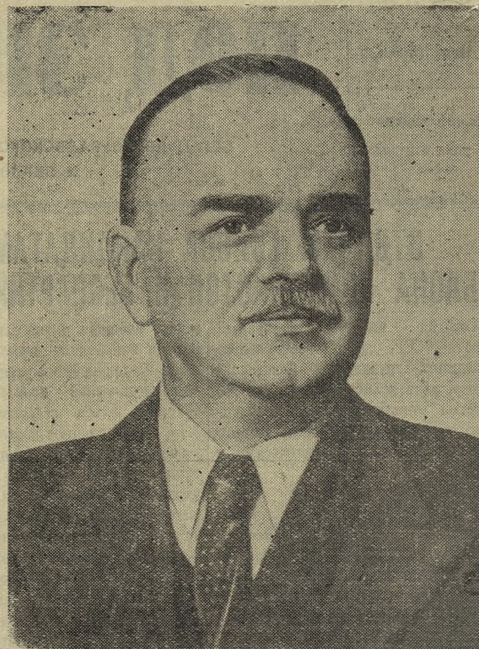
Н. М. ШВЕРНИК