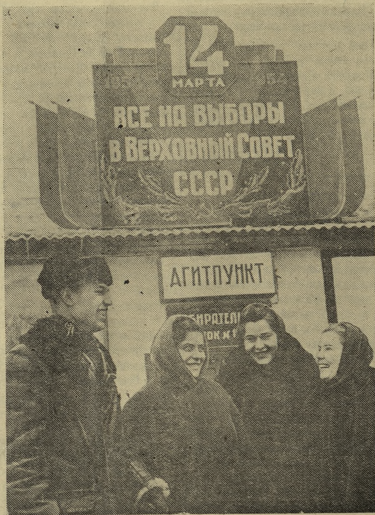
На избирательном участке № 19 (664) по выборам в Верховный Совет СССР.