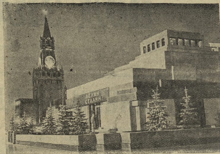
МОСКВА. Красная площадь. Мавзолей В. И. Ленина и И. В. Сталина.

Началась отгрузка первых 54 трехкомнатных домов в адрес МТС Карагандинской, Омской и Павлодарской областей. В пункты назначения отправлены также 26 вагонов с деталями сборных домов. (ТАСС).