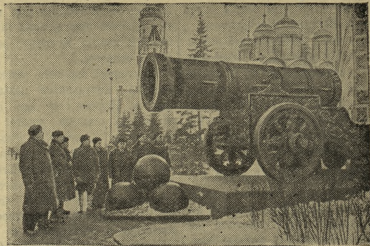
В Москве, в Большом Кремлевском дворце, состоялось Всесоюзное совещание работников совхозов, созванное ЦК КПСС и Советом Министров СССР. Участники совещания осмотрели достопримечательности Кремля.

На снимке: представители Сталинградской области у «Царь-пушки».