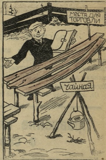
— Рынок «оборудован».

(Из письма работников медсанчасти Динасового завода).