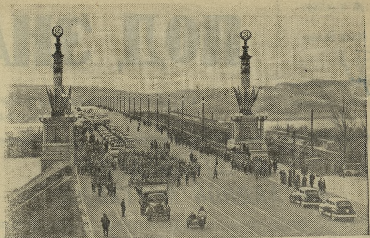
В Киеве открыт новый цельносварный мост через Днепр. Он соединил правобережную центральную часть столицы Советской Украины с крупнейшим промышленным районом города — Дарницей.

Письмо обсуждено и принято на рабочих собраниях никопольского Южнотрубного завода.