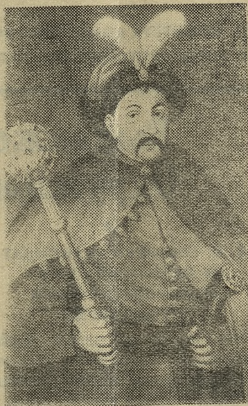
Богдан Хмельницкий (Государственный исторический музей).

В эти торжественные дни на предприятиях столицы Украины еще шире развертывается социалистическое соревнование за досрочное выполнение заданий партии и правительства. Движимые чувством братской дружбы народов и советского патриотизма, трудящиеся Киева, как и весь украинский народ, ознаменовывают большой национальный праздник — 300-летие воссоединения Украины с Россией — замечательными победами в труде.