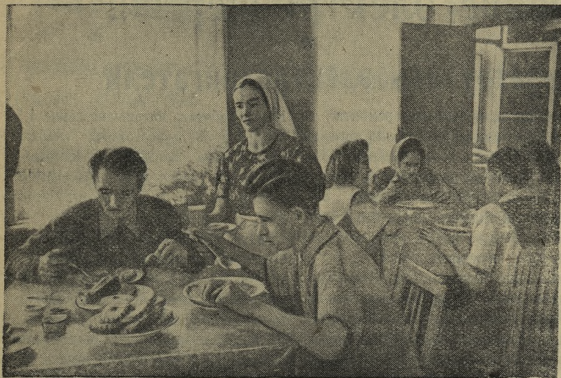
В ночном профилактории Дина сового завода ежемесячно поправляют свое здоровье 25—30 трудящихся цехов завода. НА СНИМКЕ: отдыхающие в столовой профилактория.