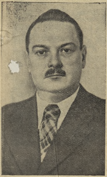
Андрей Александрович ЖДАНОВ.

ЗАВТРА ИСПОЛНЯЕТСЯ 5 ЛЕТ СО ДНЯ СМЕРТИ А. А. ЖДАНОВА.