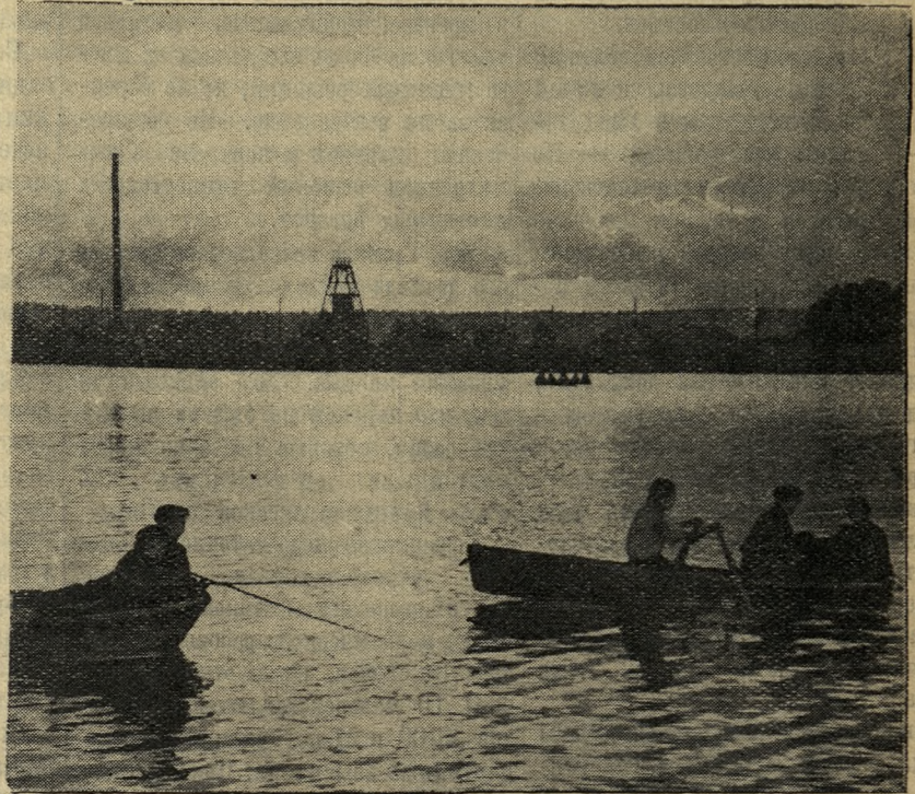
Вечером на городском пруду.