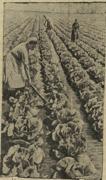
Сталинская область. Совхоз «Ясногородский» одним из первых начинает снабжать трудящихся Краматорска ранними овощами и фруктами. В нынешнем году в совхозе широко применен квадратно-гнездовой способ посадки овощей. Большая часть огородов орошается. НА СНИМКЕ: полив капусты.