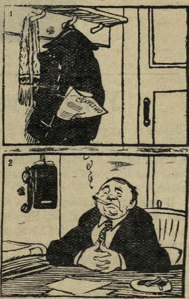
1. Пальто — на вешалке. 2. ...а шляпа в кабинете.