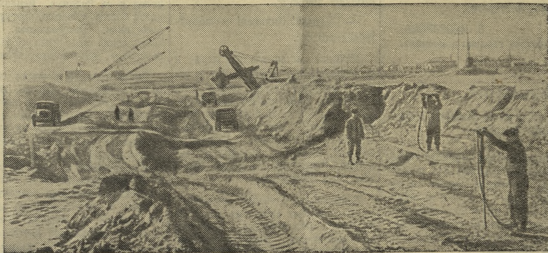
Строительство обводного канала.