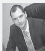
Денис Паслер, председатель правительства Свердловской области:

– Происходит качественный ребрендинг Свердловской области, переход от «старопромышленного» региона к облику современной, открытой, инвестиционно-привлекательной территории.