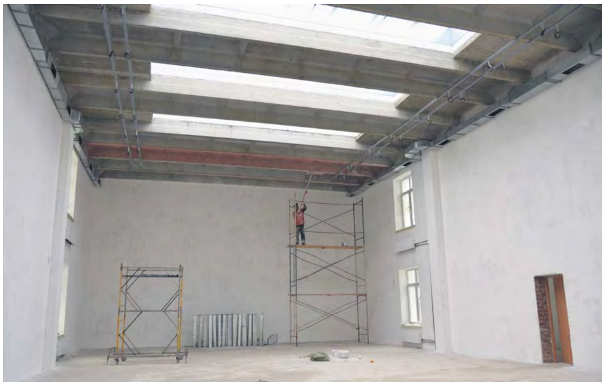
Спортзал в новой школе - с естественным освещением на потолке