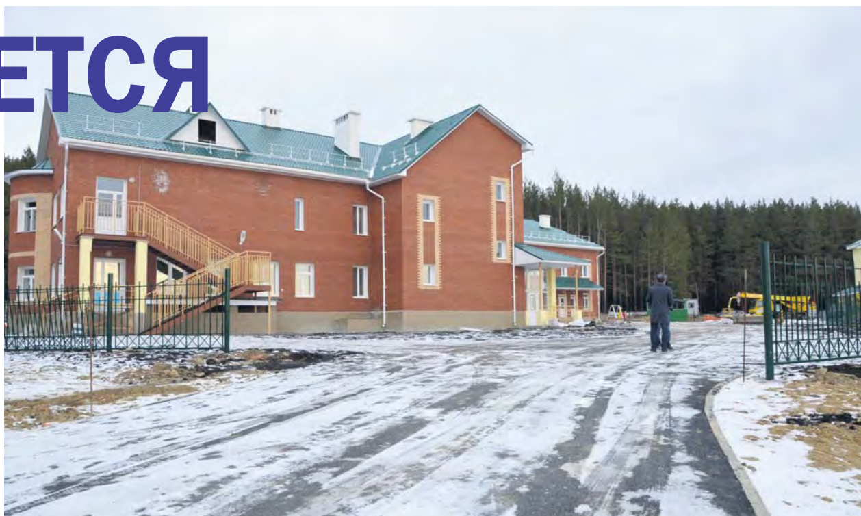
Новый детсад. Территория вокруг и на участках благоустраивается

Еще ближе к запуску детский сад. Ввод объекта запланирован во второй декаде декабря. Здесь все уже покрашено. Сейчас внутри моют и мебель расставляют. А в администрации последние котировки проводят: на поставку карнизов-