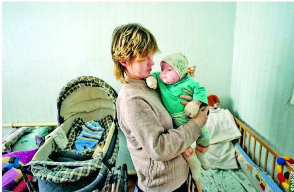
Благотворители стараются помочь мамам, попавшим в трудную жизненную ситуацию.