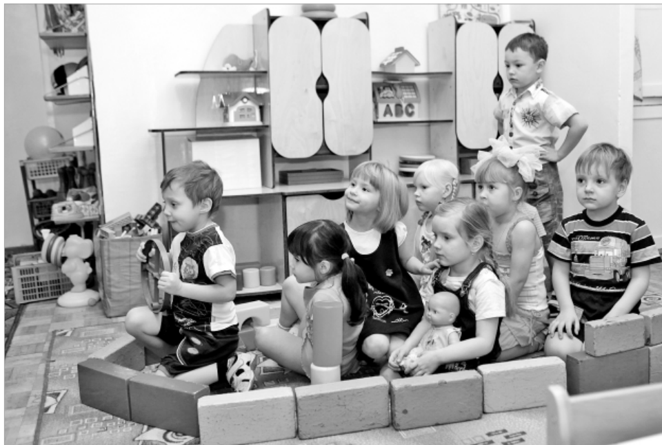
Для мам и малышей предусмотрены меры государственной поддержки.

Декретный отпуск предоставляется на 140 календарных дней (70 дней до предполагаемой даты родов, определяемой в лечебном учреждении, и 70 - после). При многоплодной беременности срок декрета увеличивается до 194 дней (84 календарных дня до родов, 110 - после).