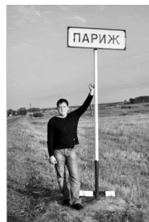
Нагайбаки говорят: Париж.

Впрочем, после беседы с атаманом захотелось побывать в ...Париже. Очередное казачье местечко, овеянное легендами. Расположен этот поселок