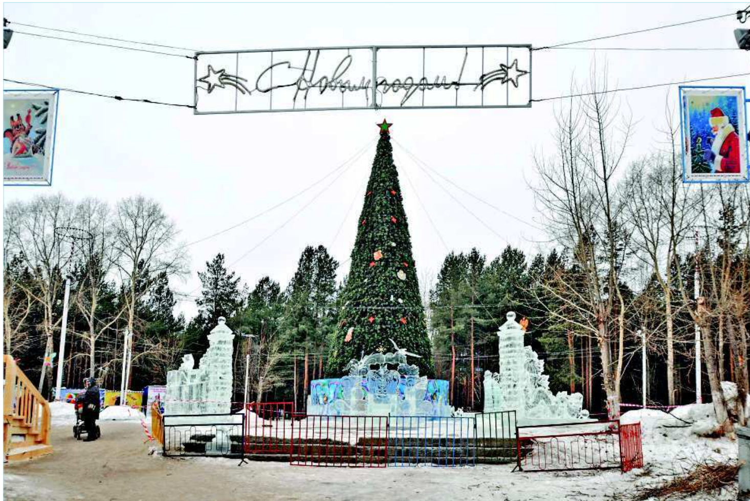
Ледовый городок почти готов к открытию.