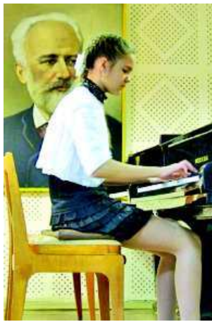
Большая часть участников - девочки.

Волновались перед выступлением не только сами музыканты, но и их преподаватели. Однако юные артисты, обуздав эмоции и чинно поклонившись перед выступлением, садились за рояль. Одни отыгрывали без сучка и задоринки, другие, чуть споткнувшись. Несмотря на некоторые шероховатости, любители классической музыки с удовольствием послушали в этот день произведения Гречанинова и Гедике, Стрибога и Нефе, Штрауса и Баха.