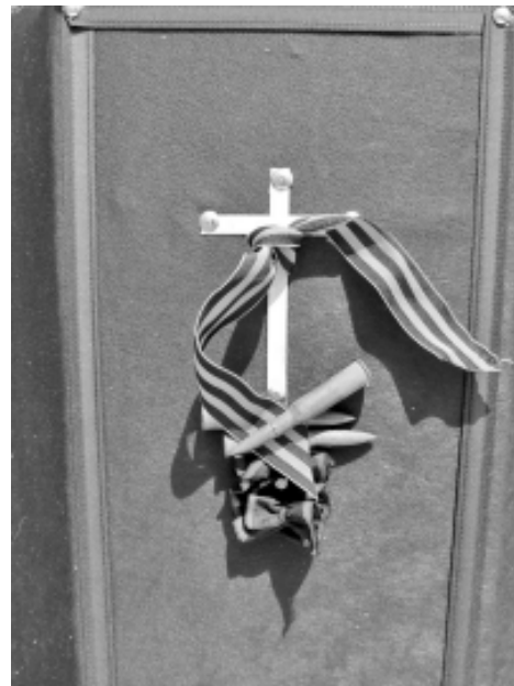
"Помним. Гордимся. Наследуем!"