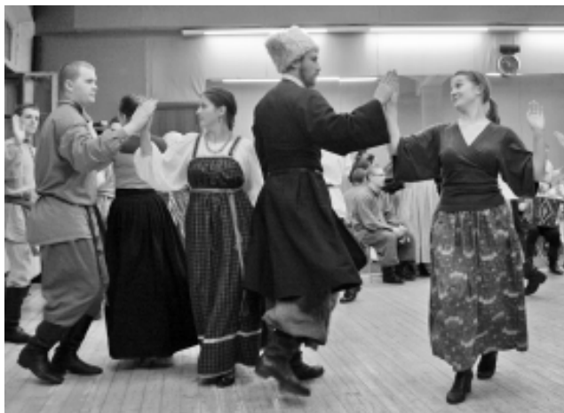
Кадриль жива и в новом веке.