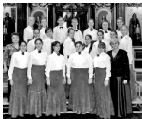
Хор "Школьные годы" с успехом выступил на "Невских хоровых ассамблеях".