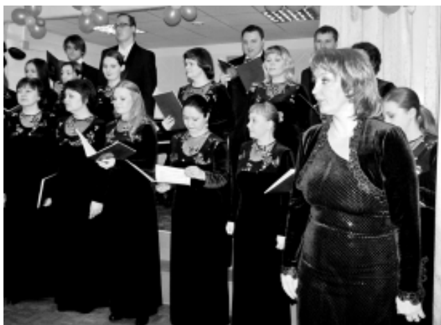
"Сольвейг" познакомил юных музыкантов ПДШИ с многогранностью хорового искусства.

В конце прошлой недели в Детской школе искусств, где обучаются азам музыкальной грамоты юные первоуральцы, состоялся вечер хоровой музыки.