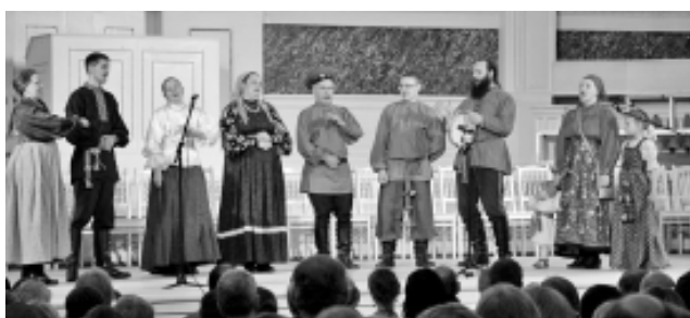
На сцене первоуральская "Воля".

Сейчас в ЦДО ждут посылку с призом, которая должна прийти в управление образования.