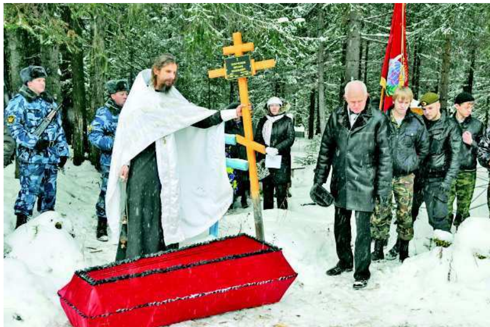
Дань уважения солдату. В могилу насыпали и землю оттуда, где погиб наш земляк.

Спустя семь месяцев другой участник ржевского противостояния, германский солдат, описал такую картину: "Война прокатилась по тогда еще желтому морю урожайных полей. Раны видны отдельными участками, которые оставила фурия: глубокие воронки, наскоро оборудованные стрелковые позиции, земляные дыры, небольшие рвы. А вот здесь ров от танка противника, заполненный вонючей болотной жидкостью,