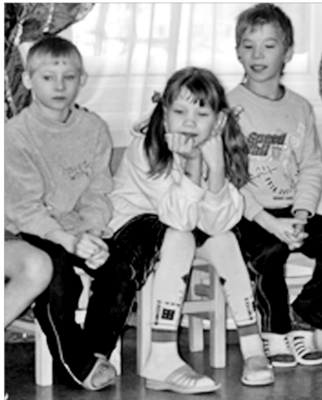
Детей можно взять в семью на время.