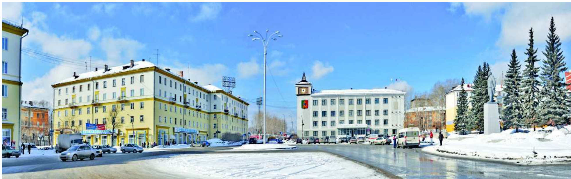
Центр города. Площадь Победы.