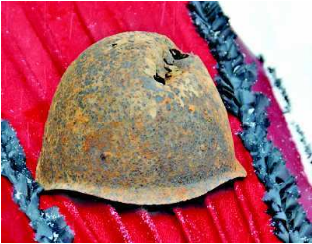
Та самая каска из ржевских лесов. Наша память не ржавеет.