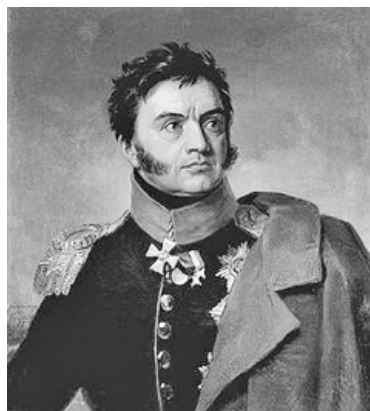
Н. Н. Раевский.

- ...весной сорок третьего года. Тем более что в музее третьей школы есть тому документальные свидетельства. Можно почерпнуть здесь и сведения о битве под Москвой, начавшейся с контрнаступления советских войск 5-6 декабря 1941 года против фашистских захватчиков. И пятое-шестое декабря отмечается как День воинской славы России.