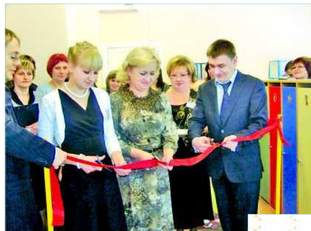
Перерезав красную ленту, почетные гости открыли еще одну дополнительную группу для дошколят.

Первого декабря в детском саду № 2 в поселке Вересовка открылась дополнительная группа для дошколят.